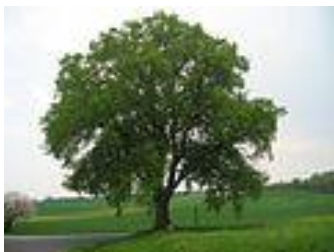
Žižická památná lípa